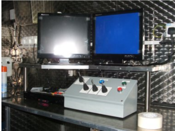
puesto de mando