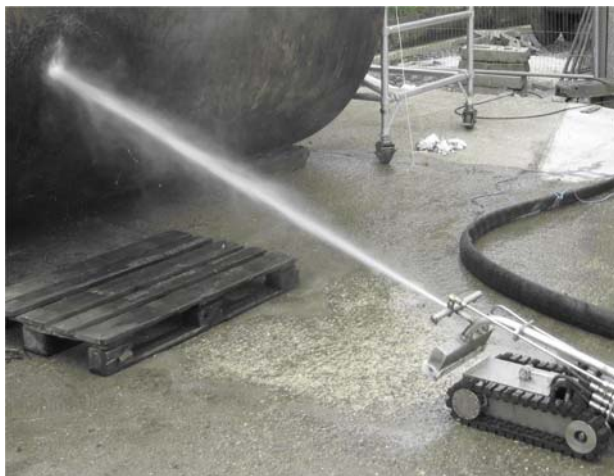
canon de agua