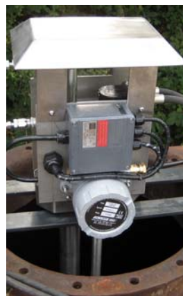
d tector de gases y camera video con luz